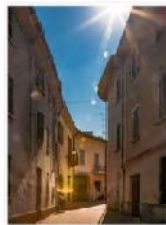
IMG_0124 Edit 4050Frame