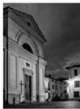
DSCF3613 RW 4050Frame