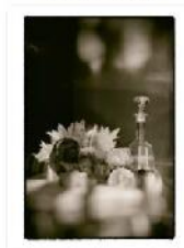
IMG_0604 Edit 4050Frame