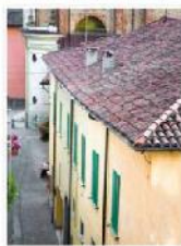
IMG_0325 Edit 4050Frame