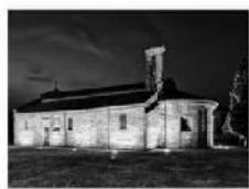
IMG_0417_8_9New Edit 4050Frame