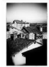
IMG_014 RW 4050Frame