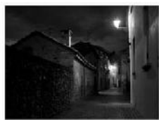
DSCF5530 Edit 4050Frame