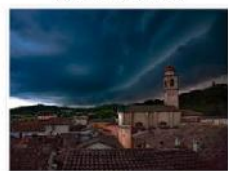
IMG_0320 Edit 4050Frame